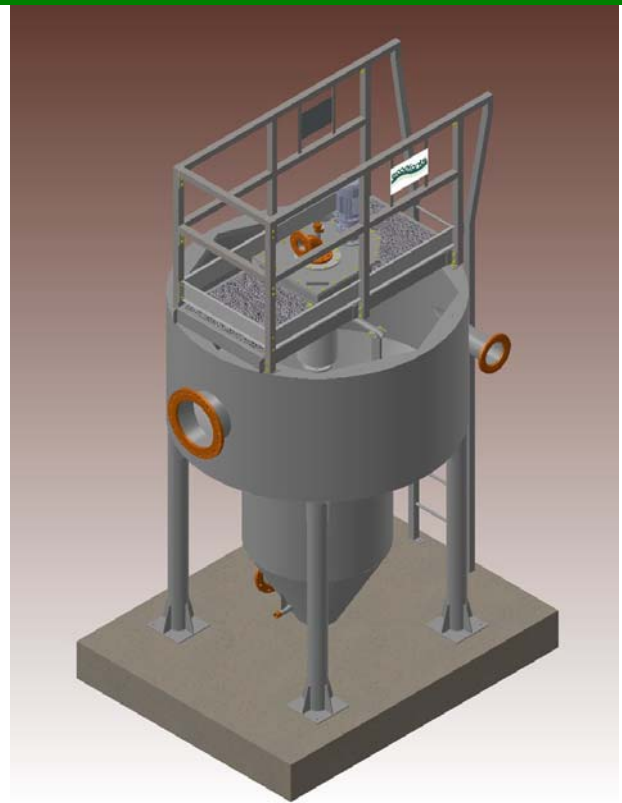
DFO con vasca metallica