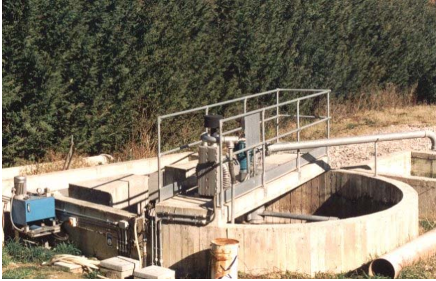
DFO con vasca in cemento