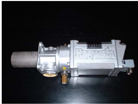
Accenditore pilota Pilot burner