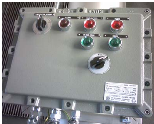
Pannello di controllo (Atex EExd) Control panel (Atex EExd)